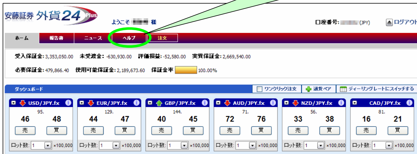
「外貨24Plus WEB」取引画面上部

取引画面上部のメニューから、「ヘルプ」をクリックしていただくと、より詳細な操作方法について記載されたページが表示されます。